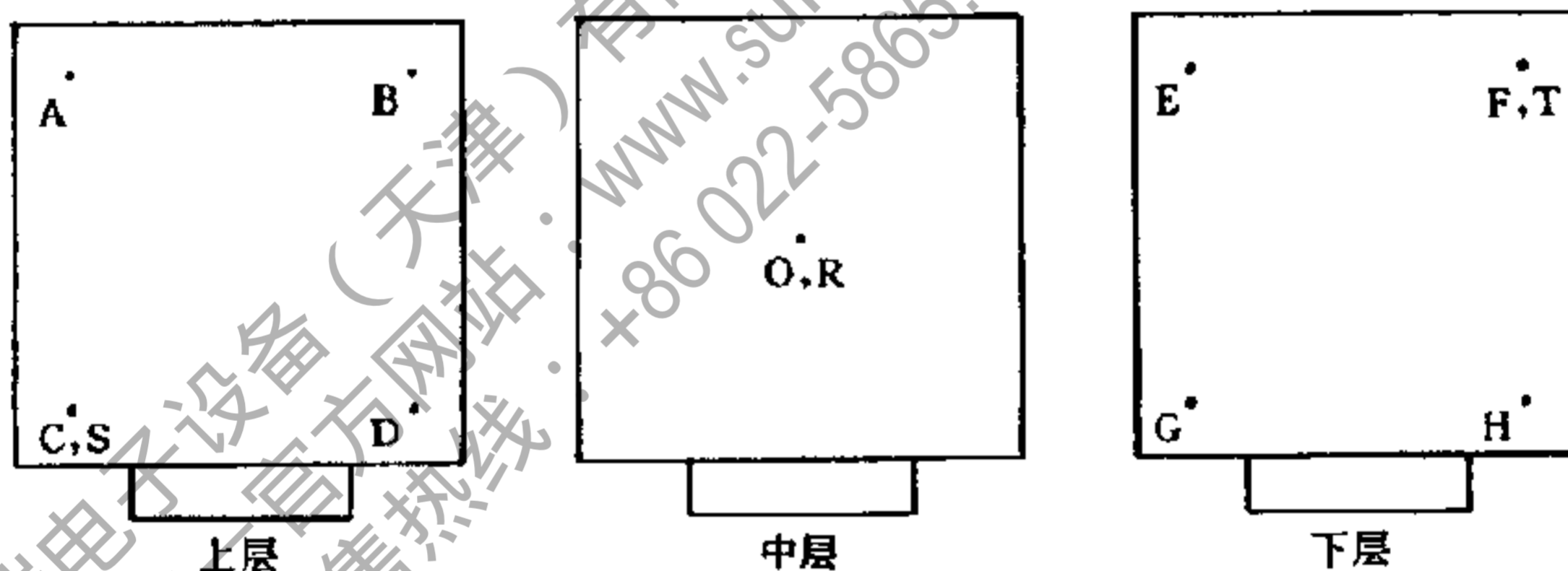
图 1 容积不大于 2\text{m}^3 的试验箱(室)温、湿度测量点布置图

6.1.1.1 试验箱(室)的容积不大于 2\text{m}^3 时,温度测量点为 9 个,相对湿度测量点为 3 个。测量点的位置与试验箱(室)内壁距离为试验箱(室)内壁对边距离的 1/10。如图 1 所示: