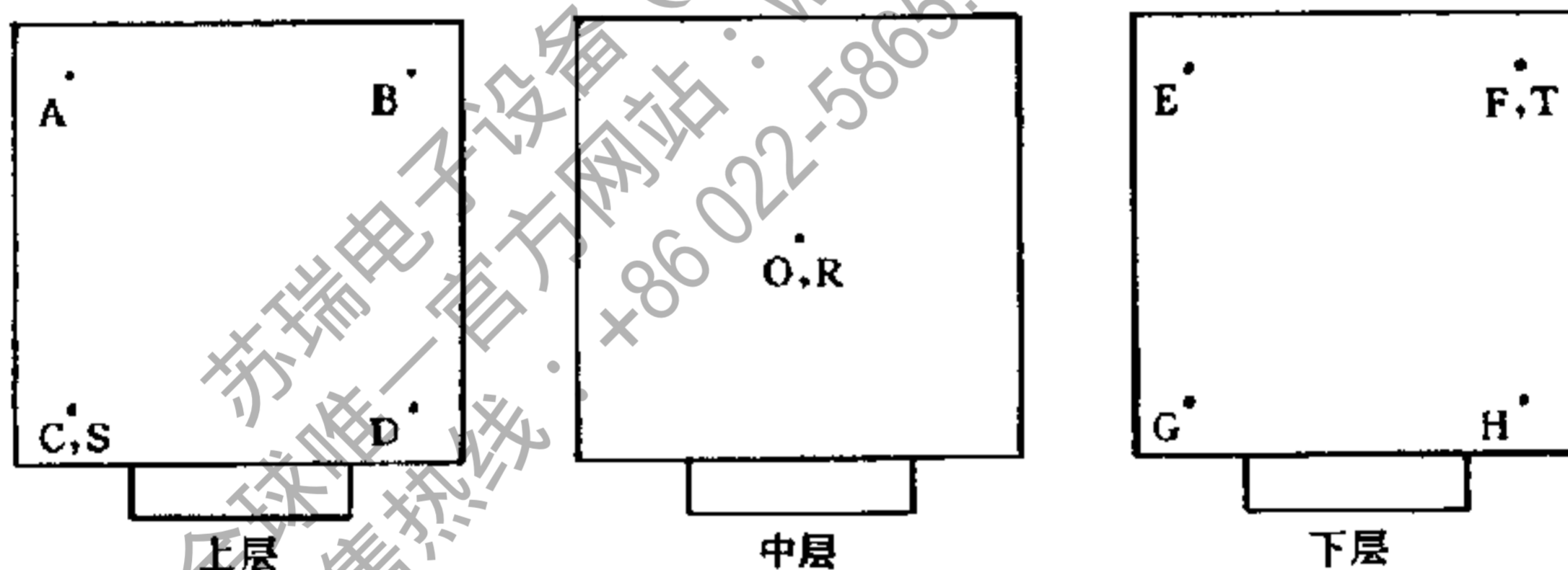
图 1 容积不大于 2\text{m}^3 的试验箱(室)温、湿度测量点布置图

6.1.1.1 试验箱(室)的容积不大于 2\text{m}^3 时,温度测量点为 9 个,相对湿度测量点为 3 个。测量点的位置与试验箱(室)内壁距离为试验箱(室)内壁对边距离的 1/10。如图 1 所示: