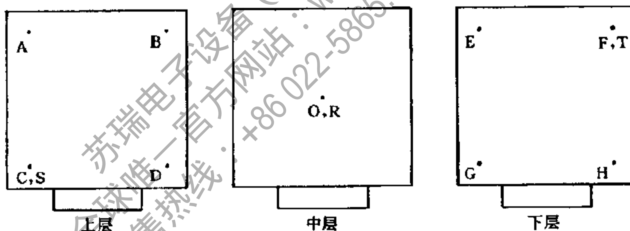
图 1 容积不大于 2\text{m}^3 的试验箱(室)温、湿度测量点布置图

6.1.1.1 试验箱(室)的容积不大于 2\text{m}^3 时,温度测量点为 9 个,相对湿度测量点为 3 个。测量点的位置与试验箱(室)内壁距离为试验箱(室)内壁对边距离的 1/10。如图 1 所示: